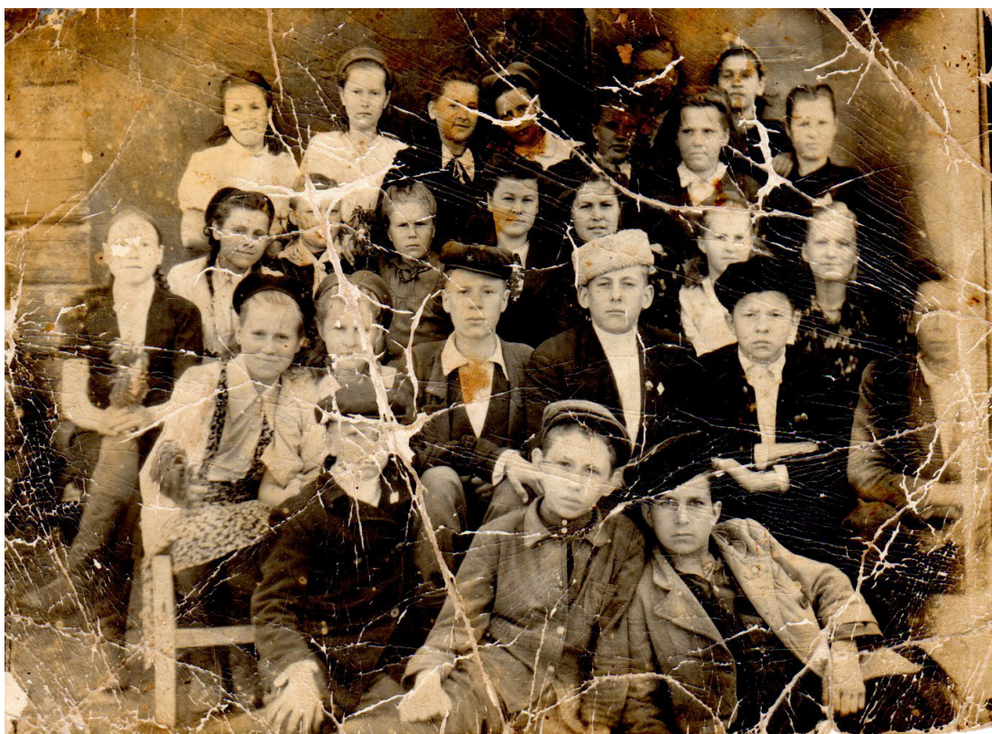
Школьные годы. Фото сделано до начала войны.