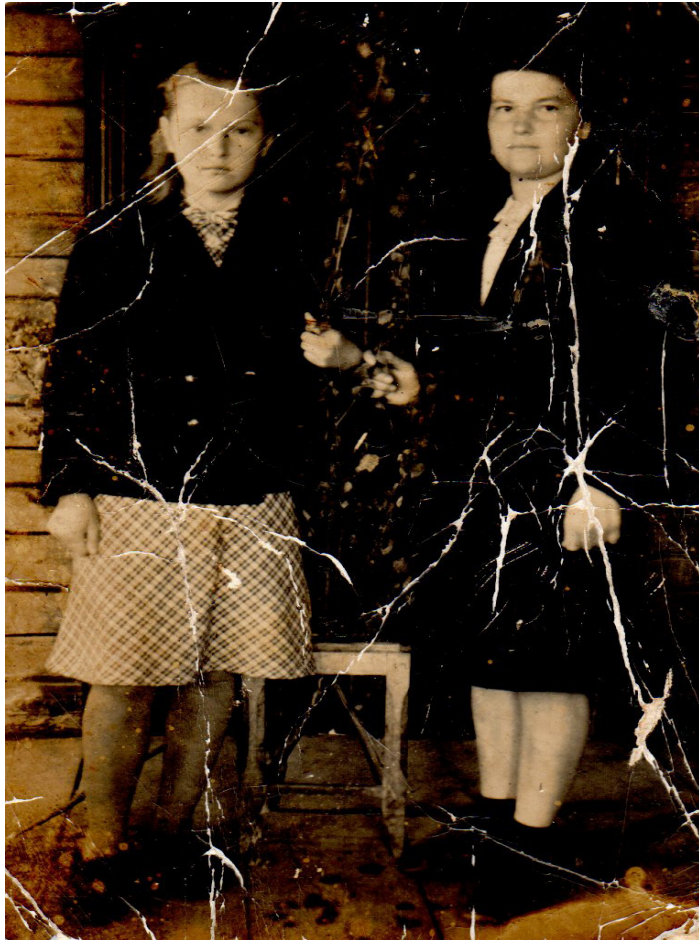
Фотографии из семейного альбома