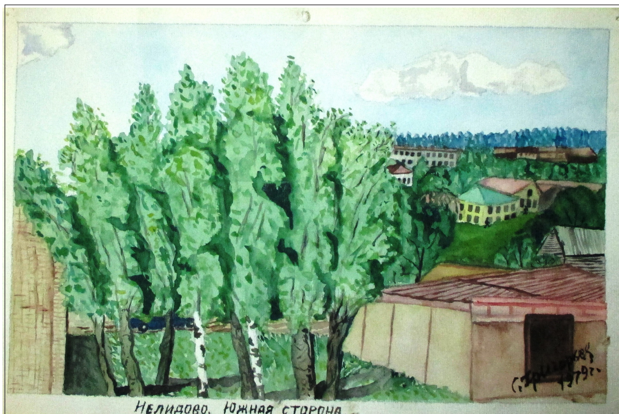
Рисунок С.П. Григорьева “Нелидово. Южная сторона” 1979 год.

вошли в сборник “МЕЖА” (2009). Мое любимое из них - “Раздумья ветерана”. Родина оценила его заслуги: он награжден орденом Красной Звезды, орденом Отечественной войны I степени, многими медалями за военные и трудовые подвиги, областными и районными почетными грамотами. Я горжусь моим прадедушкой!