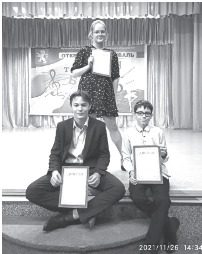
Чтецы литературного кружка «Лира»

Жюри конкурса высоко оценило выступления наших конкурсантов. В номинации «Хореография. Эстрадный танец» почетное