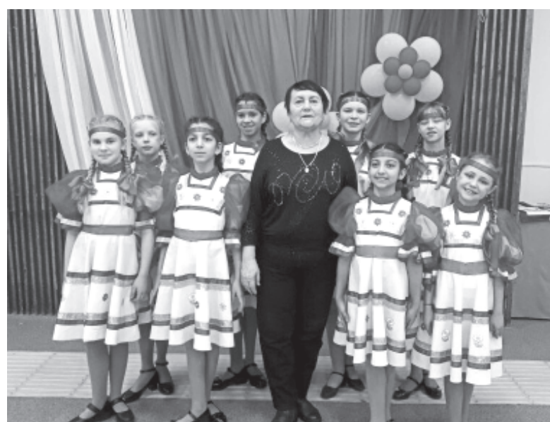
Хореографический коллектив «Жемчужинка»

и в то же время грустный. На высоком холме стоит русский солдат, опустив автомат и склонив голову. Внизу – журавлиная стая, будто уносящая души погибших в войне... Хочется поклониться героизму советских воинов, кото-