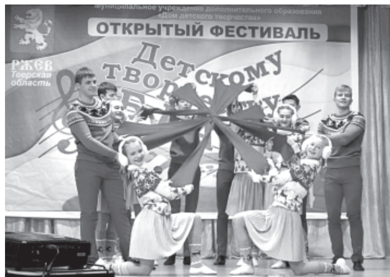
Хореографический коллектив «Акварель»

На обратном пути мы заехали на Ржевский мемориал Советскому солдату. Мне очень понравилось, как он сделан. Территория мемориала ограждена баннерами с военной тематикой. Вокруг высажены декоративные кустарники. Сам памятник очень большой, величественный