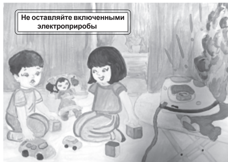
Не оставляйте включенными электроприборы