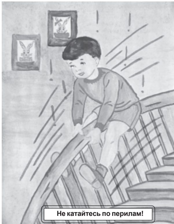
Не катайтесь по перилам!