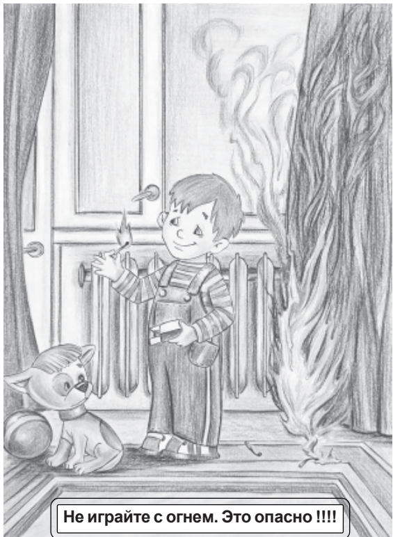
Не играйте с огнем. Это опасно !!!!

В рамках месячника по безопасности в Доме детского творчества организован конкурс рисунков на тему «Безопасность в нашей жизни». Это мероприятие направлено на формирование культуры безопасного поведения детей и подростков в различных ситуациях. В конкурсе активное участие приняли воспитанники объединений: «Теннис», «Карате», «Бокс», «Издательское дело», «Жемчужинка» и «Акварель». В своих рисунках юные художники показали свое видение безопасного поведения на дороге, водных объектах, спортивных площадках, на льду, в сети интернет, а также отразили печальные последствия шалости с огнем.