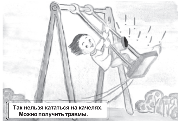
Так нельзя кататься на качелях. Можно получить травмы.