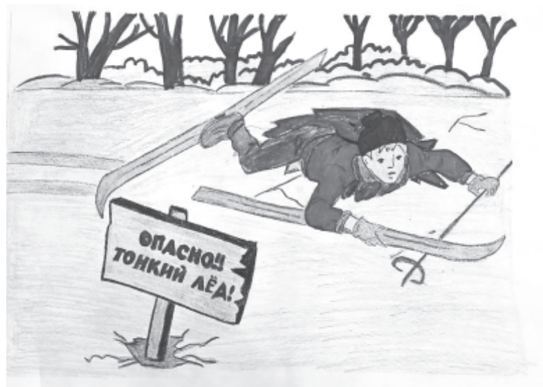
Благодаря выполнению творческого задания ребята поняли, что во многом безопасность зависит и от них самих, от их знаний и умений.