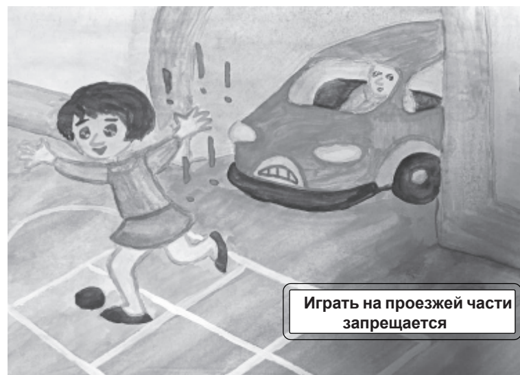
Играть на проезжей части запрещается