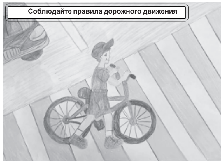
Соблюдайте правила дорожного движения