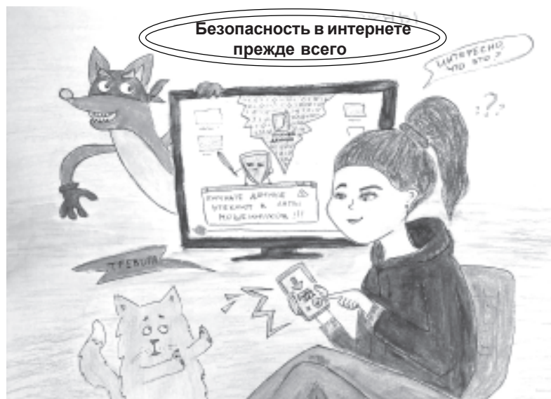
Безопасность в интернете прежде всего