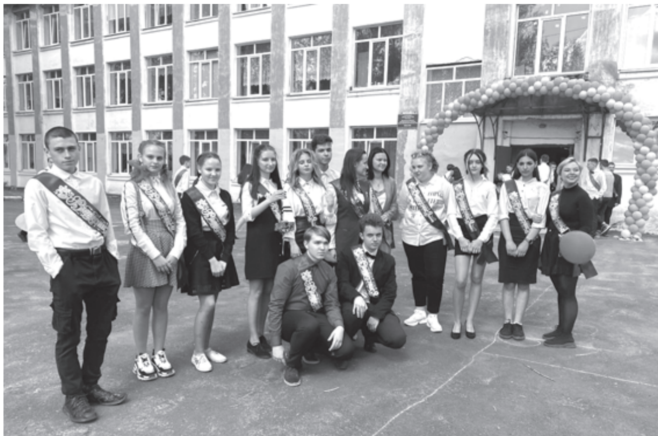
На снимке: выпускники 9-а класса школы №4.