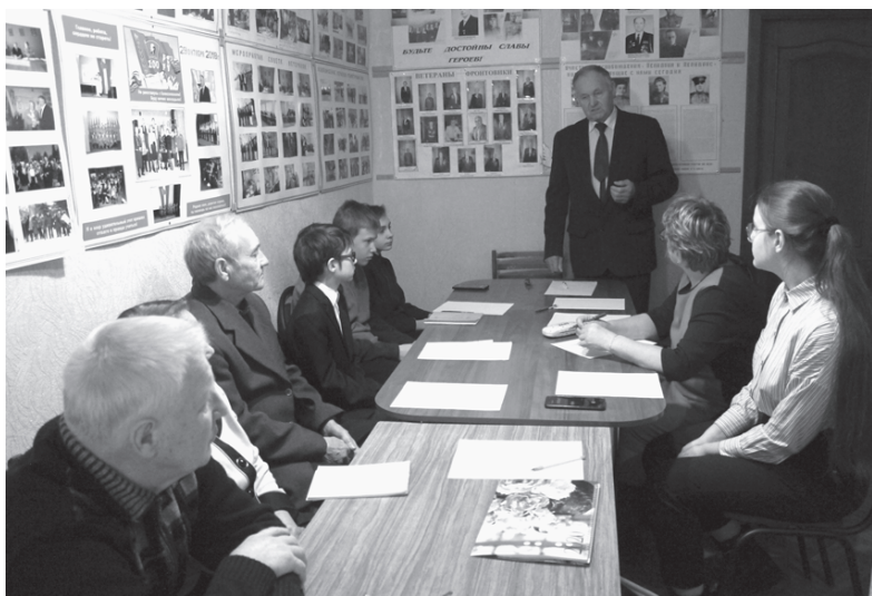
Общение с ветеранами

«Совет ветеранов был создан в 1987 году, в прошлом году отметили 30 лет. Наша ветеранская организация насчитывает 3,5 тысячи человек, на учете двадцать четыре организации. На сегодняшний день у нас в городе есть участники войны, их всего шестнадцать человек, которые непосредственно принимали участие в боевых действиях. Возраст и здоровье этих людей не позволяет им прийти сюда. Есть участники войны, которым 98 и 95 лет. Еще год назад некоторые приходили к нам, встречались с ребятами.