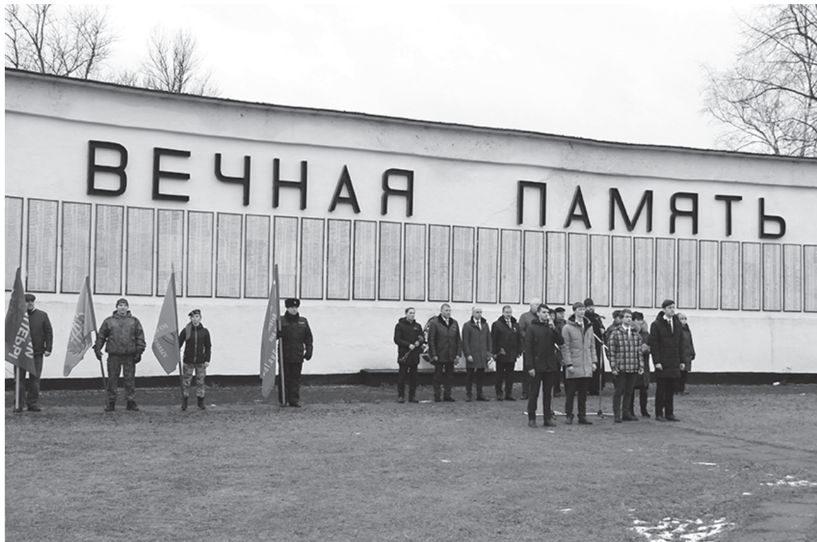
На снимке: митинг у мемориала Славы на пл. Жукова в честь 78-ой годовщины освобождения г. Нелидово от немецко-фашистских захватчиков

Станция Нелидово имела особое значение для всей Ржев-