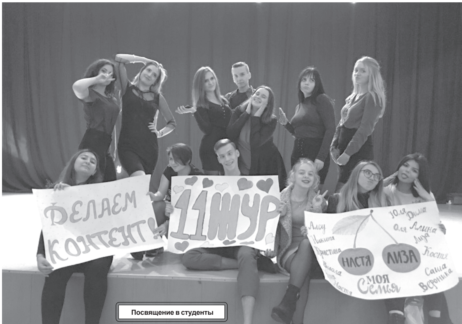
Посвящение в студенты

Как же проходит обычный день студента-журналиста? Если это рядовой учебный день в семестре, то твои трудные жизненные решения начинаются ещё до учебы. Во-первых, нужно не проспать. Это важно, ведь часто самые тяжёлые пары, которые нельзя пропускать, ставят именно первыми. Чтобы облегчить себе жизнь на сессии, о которой я расскажу чуть позже, лучше посещать все предметы, ведь «автоматы» очень помогают студентам. Так что откладывать будильник на пару часов или при-