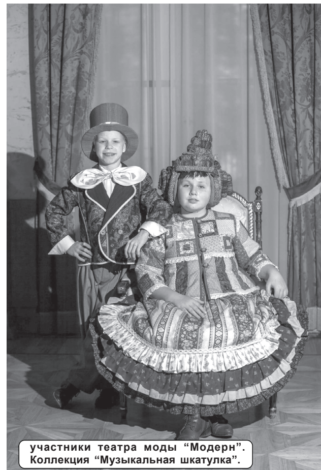
участники театра моды “Модерн”. Коллекция “Музыкальная шкатулка”.