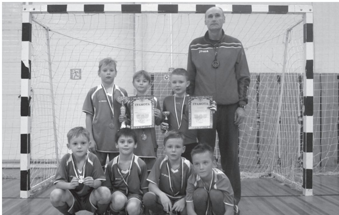
На снимке: призеры по мини-футболу на Кубок Дома детского творчества г.Удомли (2019г.)

О.В.: В связи с вводом в эксплуатацию плавательного бассейна в 2013 году в школе открыто отделение плавания. В том же году нам из Твери передали оборудование для мотоциклетного спорта.