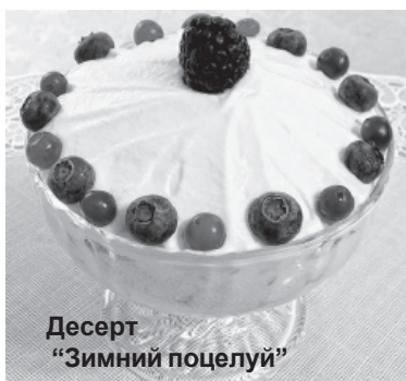
Десерт «Зимний поцелуй»