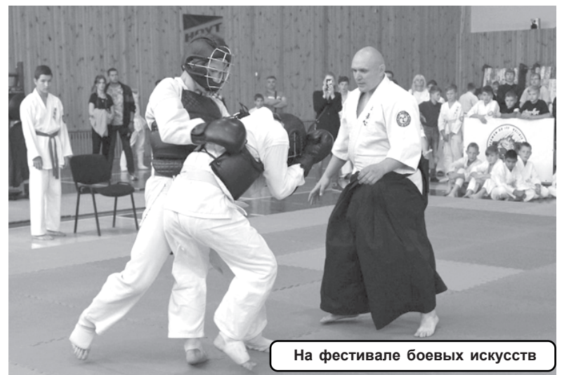
На фестивале боевых искусств