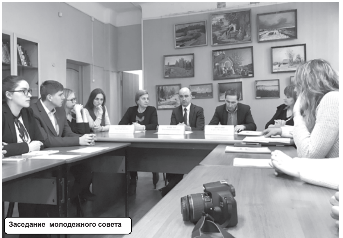
Заседание молодежного совета