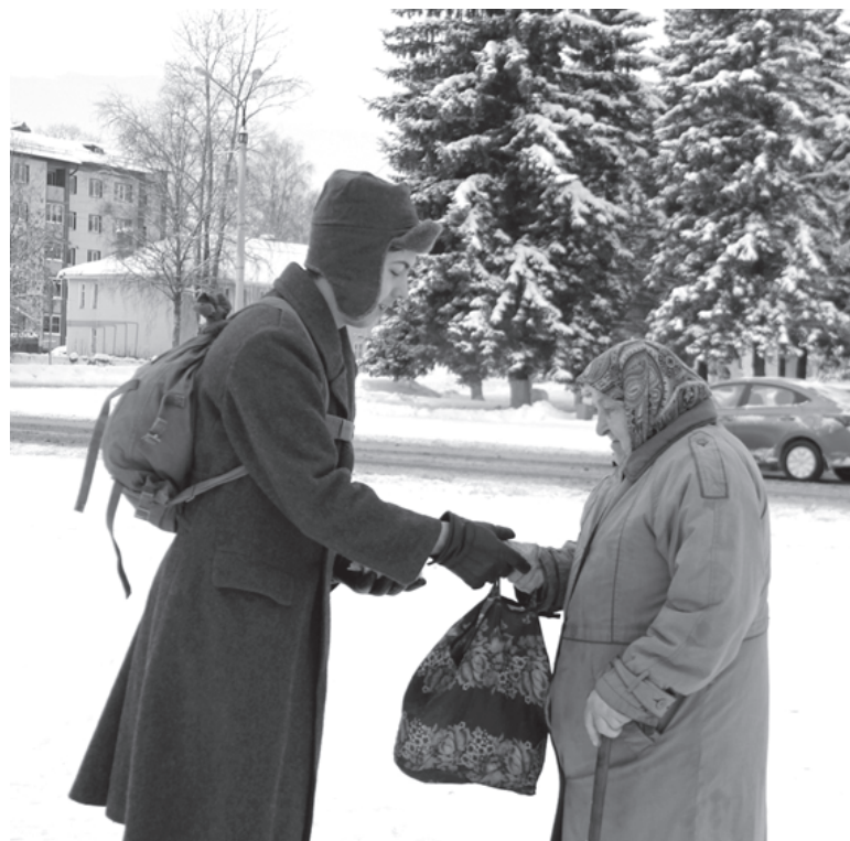
На снимке: участник акции вручает кусочек хлеба ветерану.