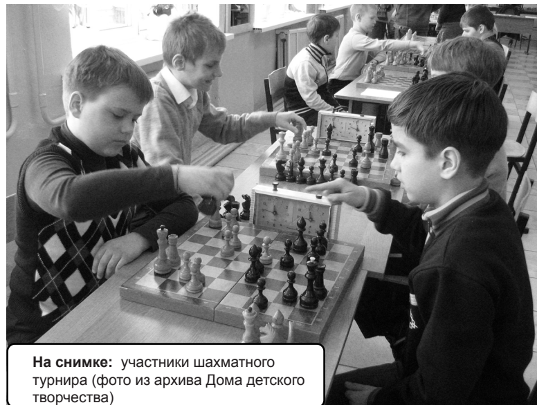
На снимке: участники шахматного турнира