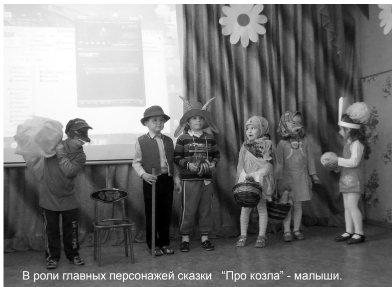
В роли главных персонажей сказки «Про козла» - малыши.

15 мая отмечается Международный день семьи. Семья – самое главное в жизни для каждого из нас. Это близкие и родные люди, те, кого мы любим, с кого берем пример, о ком заботимся, кому желаем добра и счастья.