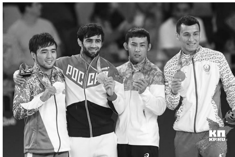
Первое золото в Рио-де-Жанейро досталось российскому спортсмену - Беслану Мудранову.