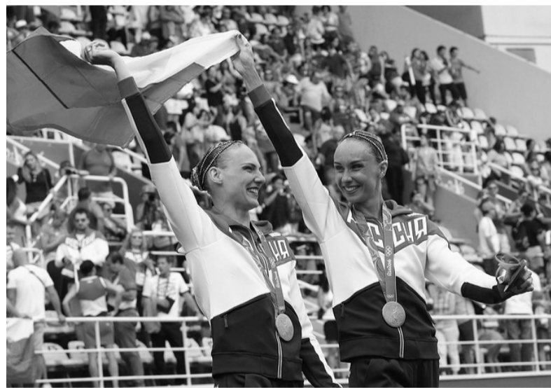
Светлана Ромашина и Наталья Ищенко завоевали золотые медали Игр в Рио-де-Жанейро в дуэте, став четырехкратными олимпийскими чемпионками.