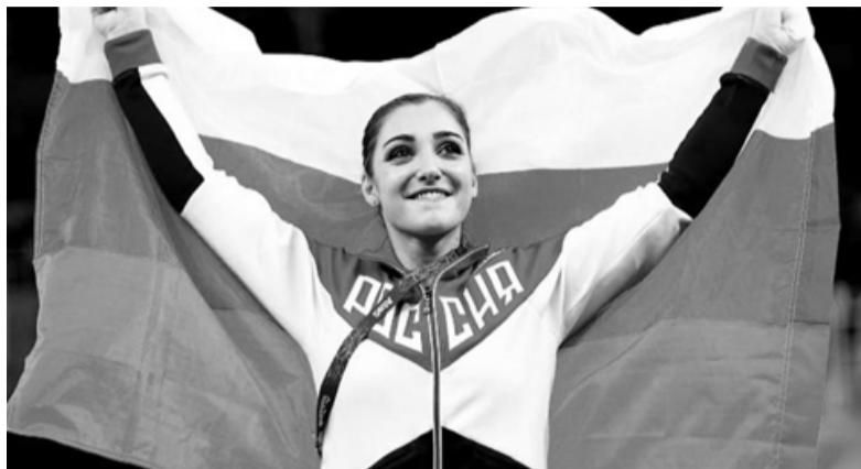
Алия Мустафина - трехкратный победитель Олимпиады в Рио-де-Жанейро

Предложение по-китайски. Китайцы удивляли мир не только своими победами, но и смелыми «выходками». Самым памятным эпизодом Олимпийских игр в Рио с участием спортсменов из Китая стала... помолвка. Во время награждения победи-