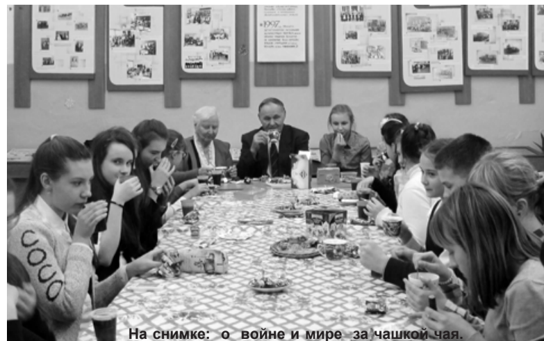
На снимке: о войне и мире за чашкой чая.