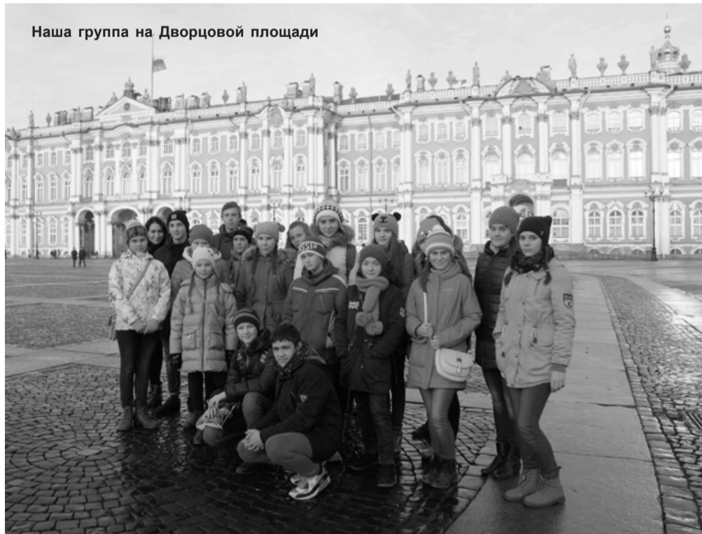
Наша группа на Дворцовой площади

В осенние каникулы состоялась поездка в Санкт-Петербург. За 3 дня мы посетили много удивительных мест, но больше всего мне запомнились Эрмитаж, Кунсткамера и Океанариум.