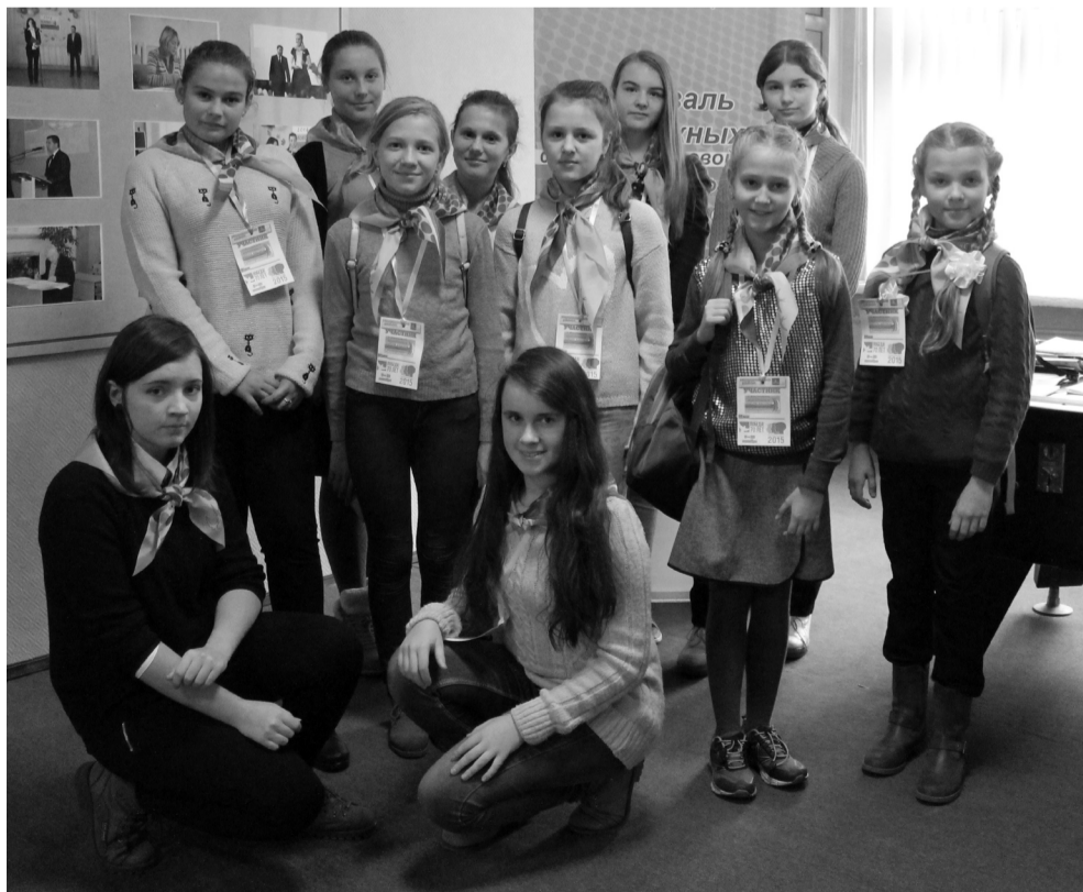
На снимке: юнкоры молодежной газеты «Животворящее слово»