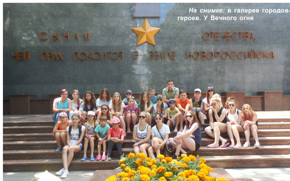
На снимке: в галерее городов-героев. У Вечного огня

вершаем прогулку на теплоходе в открытое море, где встречаемся с дельфинами... И впервые купаемся в море. Оно там чистое, теплое, ласковое.