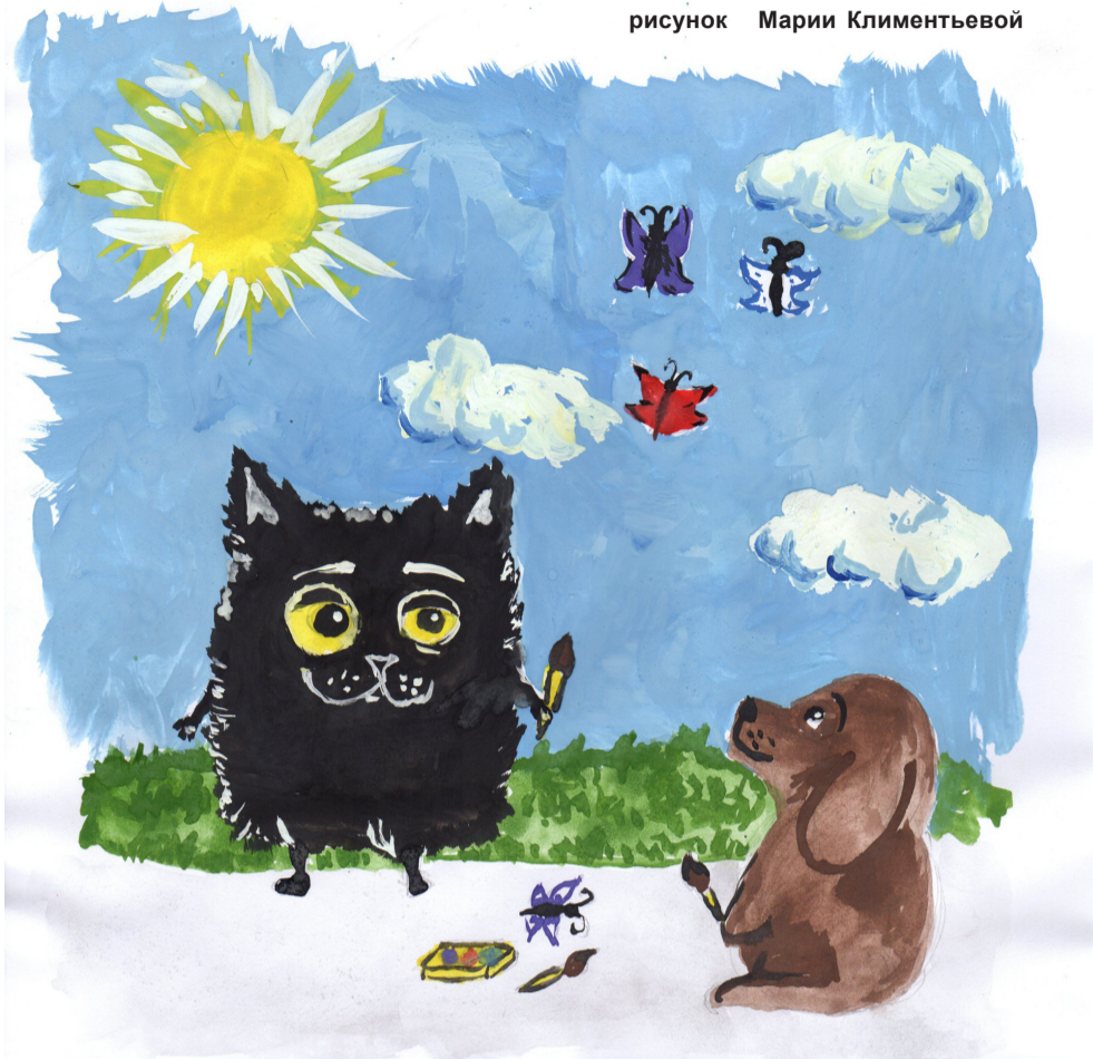
рисунок Марии Климентьевой

Жил-был котенок. Звали его Клякса. Он очень любил рисовать, поэтому всегда носил с собой кисточки и краски.