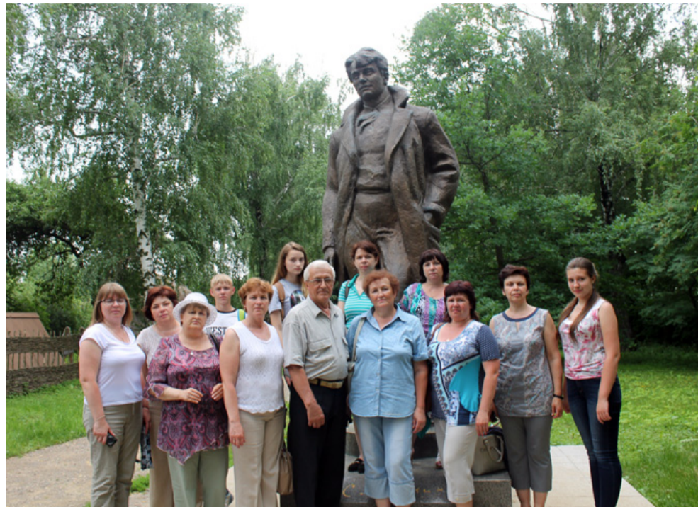
На снимке: группа у памятника С. Есенину