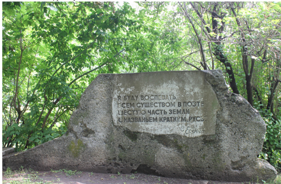
великом поэте свято хранят на Рязанской земле.

Поездка оставила в моей душе неизгладимые впечатления.