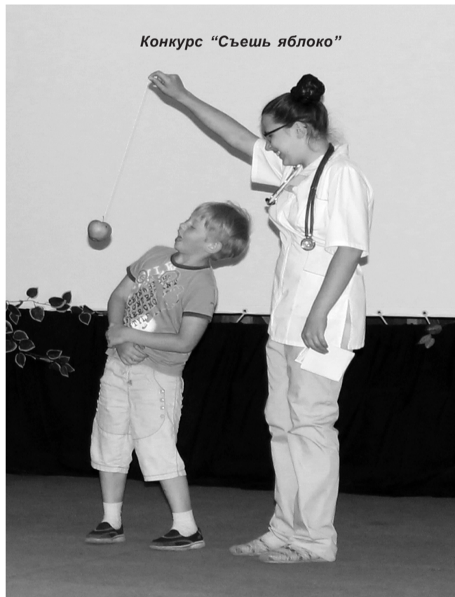
Конкурс «Съешь яблоко»